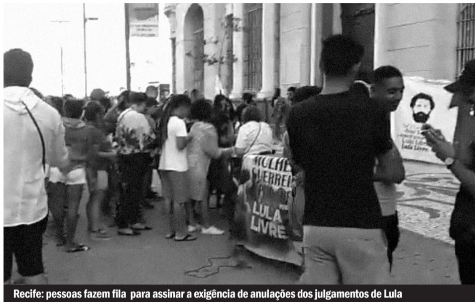
Recife: pessoas fazem fila para assinar a exigência de anulações dos julgamentos de Lula

É hora de fortalecer essa campanha nas ruas, organizando banquinhas nos bairros, em portas de empresas e nas escolas. Agora que o PT está em processo de renovação de direções, uma das tarefas centrais é colocar todo o partido, desde a base, na campanha para tirar Lula da cadeia e defender a democracia.