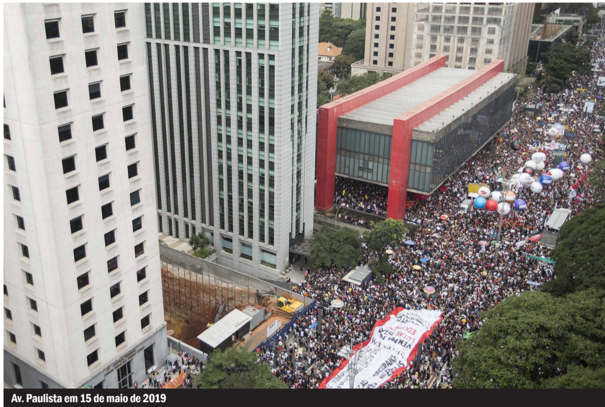
Av. Paulista em 15 de maio de 2019

Na mesma nota ainda podemos ler que “a reforma proposta não considera que o tempo de contribuição tenderá a se tornar um obstáculo complicado de ser superado por trabalhadores,