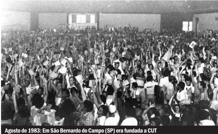
Agosto de 1983: Em São Bernardo do Campo (SP) era fundada a CUT

Já se fala que, uma vez votada em 2º turno a “reforma” da Previdência na Câmara (ver pág. 6), o governo enviaria uma PEC de “reforma sindical” com o objetivo de limitar as negociações coletivas ao âmbito das empresas, o que levaria ao fim das convenções coletivas que cobrem toda uma categoria ou setor de atividade econômica, abrindo terreno para o “sindicato por empresa”.