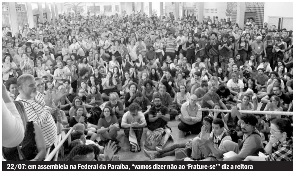
22/07: em assembleia na Federal da Paraíba, “vamos dizer não ao ‘Frature-se’” diz a reitora

liberdade da pesquisa e da produção científica, que passariam a depender de resultados no mercado.