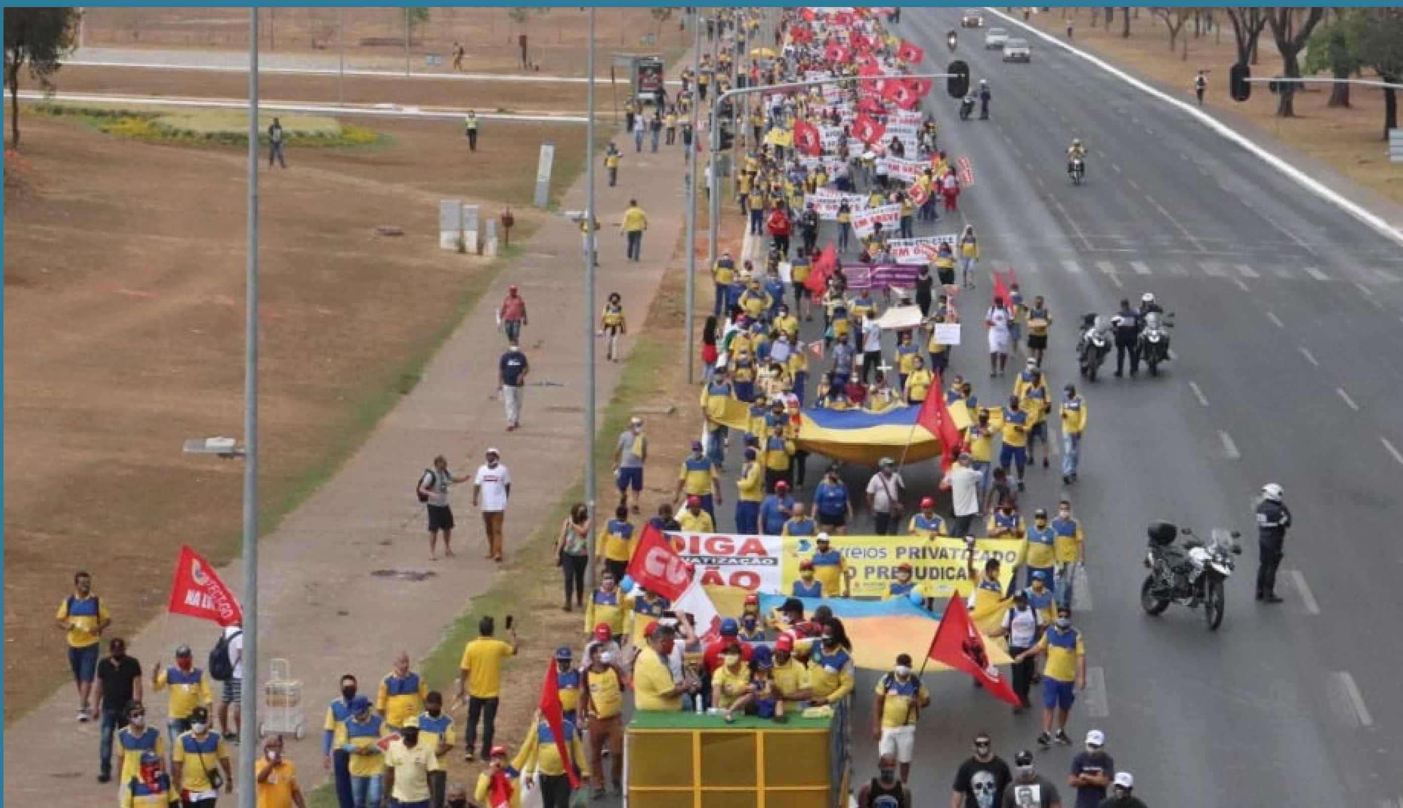
21 de setembro: milhares de grevistas dos Correios, vindos de vários estados, se manifestam em Brasília

R$ 100 mil caso os grevistas não voltassem ao trabalho.