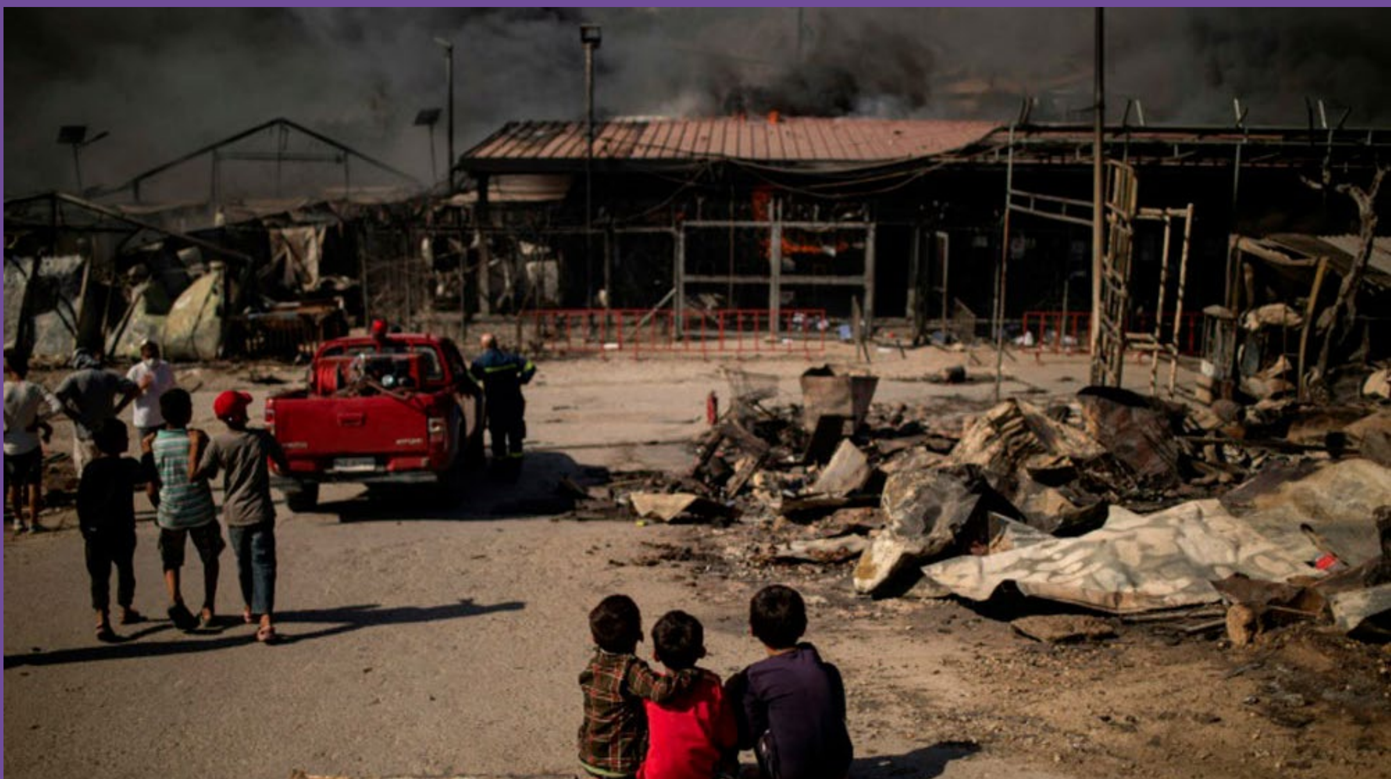
Crianças refugiadas olham o incêndio no campo de Moria