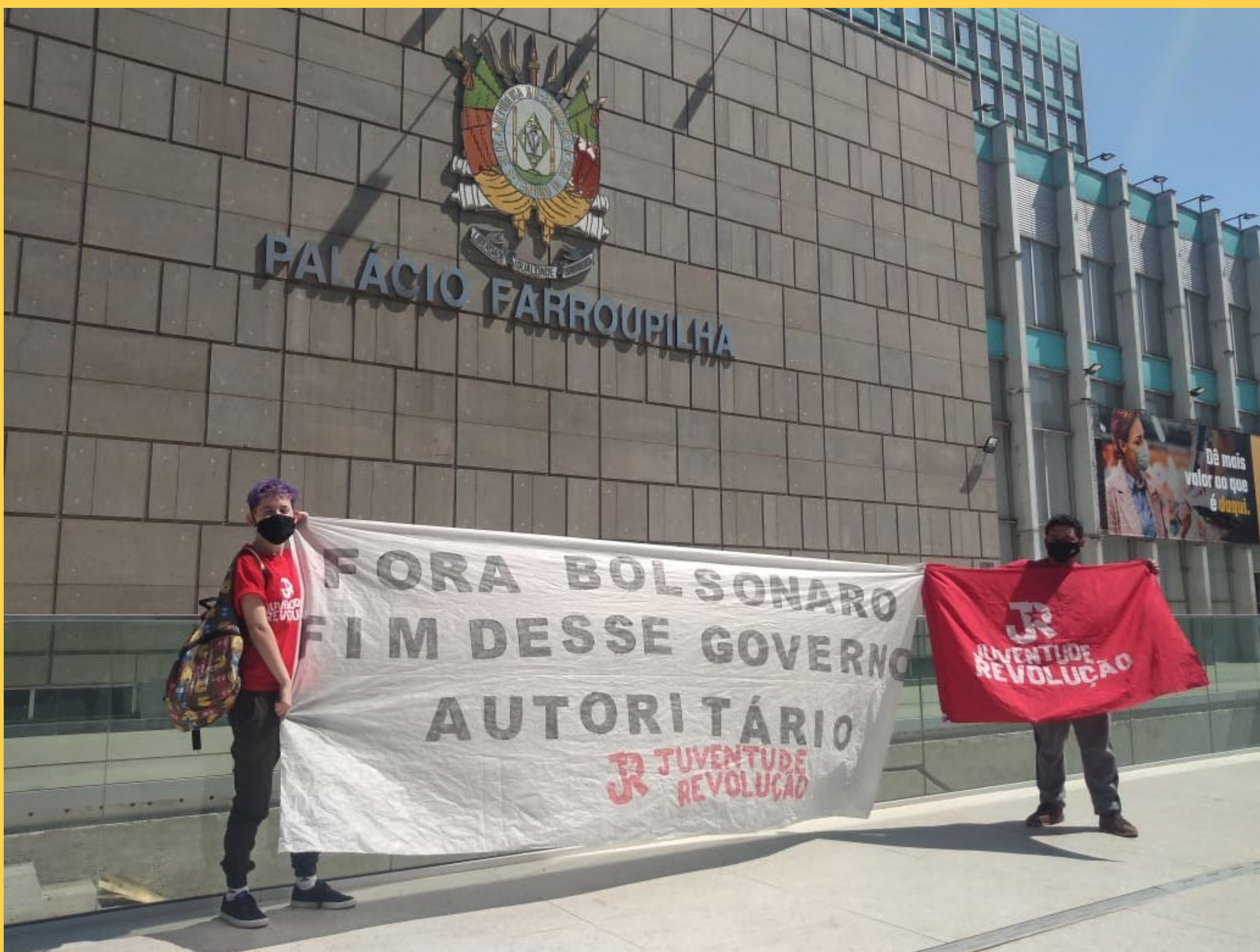
Ato no Rio Grande do Sul no dia nacional de mobilização da UNE em 23 de setembro

(íntegra em www.juventuderevolucao.com.br )